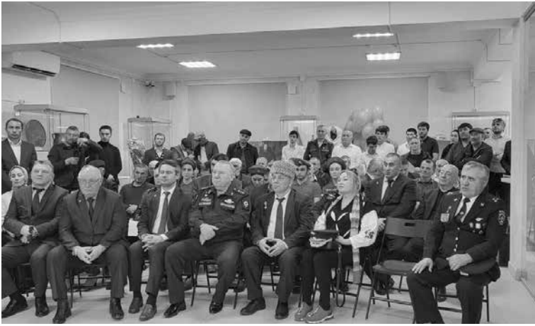
(Авал 1-аб гьумералда)

Нижер районалдаса гемемерал г'олохъаби руго Украиналда унеб хасаб операциялбуль г'ахъаллъи гьабулел.