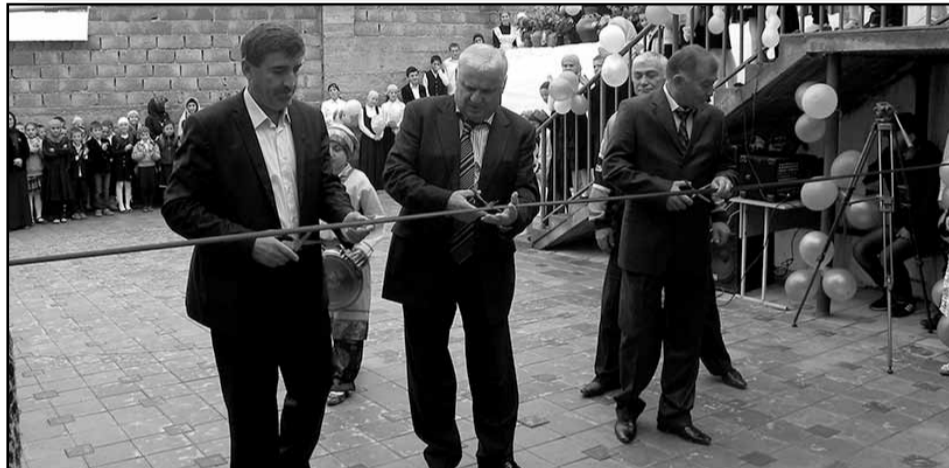
В селении Годобери Ботлихского района прошло торжественное открытие реконструированного школьного учебного корпуса