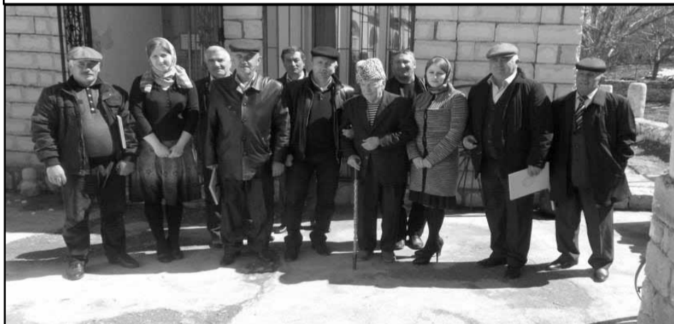
Коллектив Ботлихского управления народного образования в гостях у Народного поэта Дагестана Абасил Магомеда.