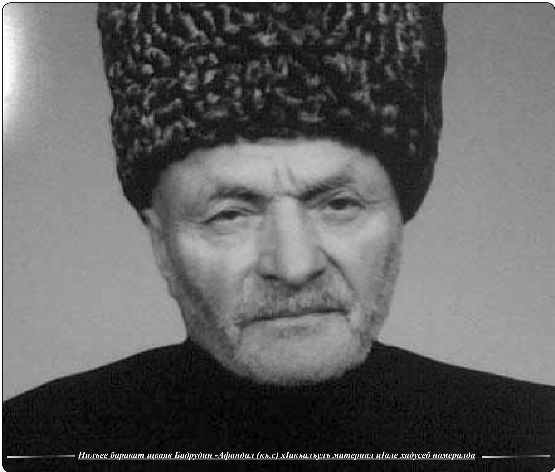
Нилъее баракат шваяв Бадрудин -Афандил (къ.с) х'акъалъулъ материал и'але хадусеб номералда